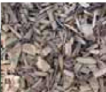
Plaquettes forestières produites