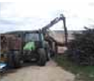
Déchetage en cours