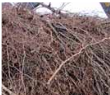
Rémanents de coupe