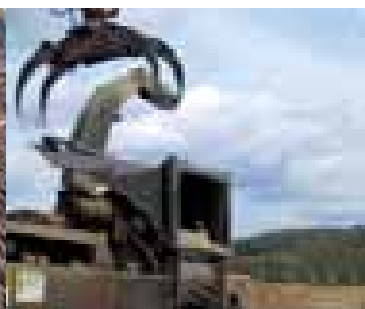
Déchetuse à grappin